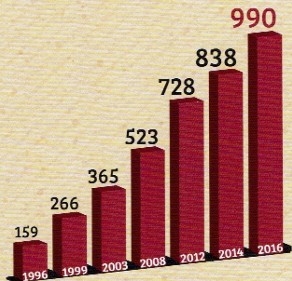
Diagramme des Adhérents

1 ÈRE PRÉSIDENTE Marcelle Gadais — 1996 - 1999 —