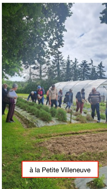
à la Petite Villeneuve